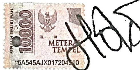
Aulia Firman Agil

Purwokerto, 12 September 2023 Yang membuat pernyataan